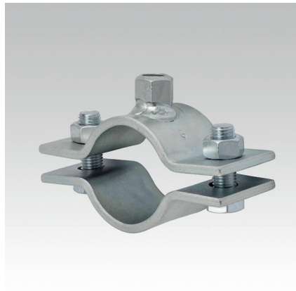
Fixpontbilincs 60 mm x 6 mm