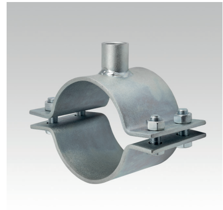
Fixpontbilincs 120 mm x 6 mm