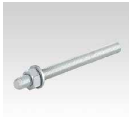
Horgonyrúd tömör- és lyukacsos kőzethez VMU-A típus, szilárdsági osztály 5.8