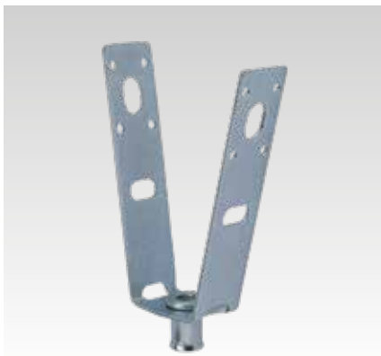
Trapézlemez függesztő beállító anyával