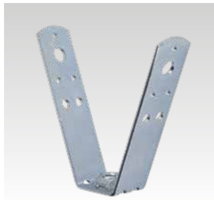
Trapézlemez függesztő ráhegesztett anyával