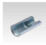
Menet ≥ M8/M10