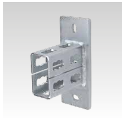
MPR-nyeregalakú rögzítő S+ típus, 41/82 és 41/124 profilhoz