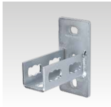
MPR-nyeregalakú rögzítő S+ típus, 41/41 és 41/62 profilhoz