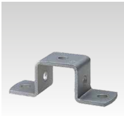
28/30 és 38/40 profilhoz