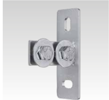
MPC-homlok összekötő, hosszirányú