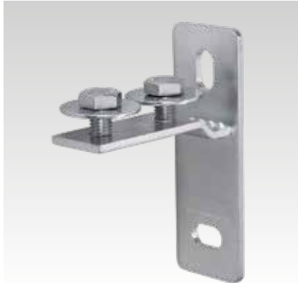
MPC-homlok összekötő, keresztirányú